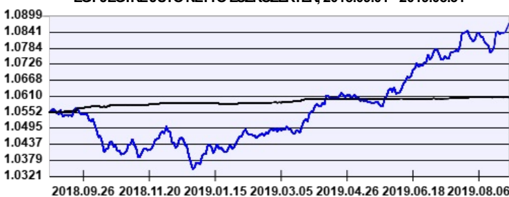
EGY JEGYRE JUTÓ NETTÓ ESZKÖZÉRTÉK, 2018.09.01 - 2019.08.31