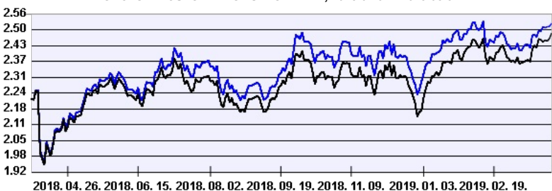
EGY JEGYRE JUTÓ NETTÓ ESZKÖZÉRTÉK, 2018.04.01 - 2019.03.31

--- Aegon Russia Részvény Befektetési Alap HUF sorozat ---- Benchmark A múltbeli hozamok nem jelentenek garanciát az alap jövőbeli teljesítményére nézve. Jelen hirdetés nem minősül ajánlattételnek vagy befektetési tanácsadásnak. A befektetés részletes feltételeit az Alap Tájékoztatója tartalmazza, mely a mindenkor érvényes kondíciós listákkal együtt megtalálható a forgalmazási helyeken. A befektetési alap forgalmazásával (vétel, tartás, eladás) kapcsolatos költségek az alap kezelési szabályzatában és a forgalmazási helyeken megismerhetők.