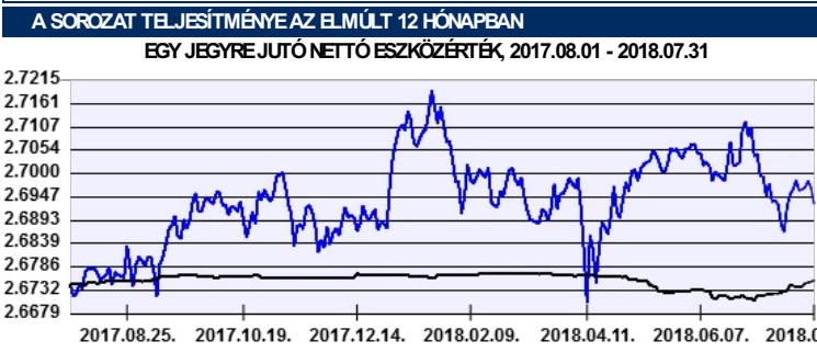
EGY JEGYRE JUTÓ NETTÓ ESZKÖZÉRTÉK, 2017.08.01 - 2018.07.31

----- Aegon Alfa Abszolút Hozamú Befektetési Alap HUF sorozat ----- Benchmark