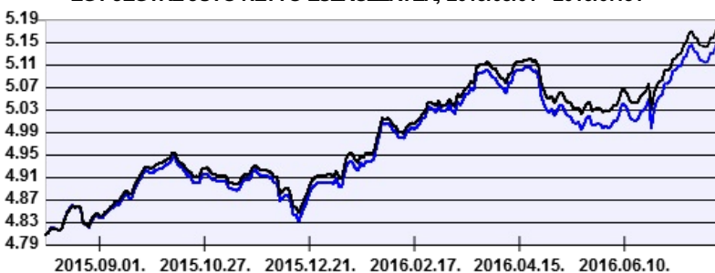
— Aegon Belföldi Kötvény Befektetési Alap — Benchmark

A múltbeli hozamok nem jelentenek garanciát az alap jövőbeli teljesítményére nézve. Jelen hirdetés nem minősül ajánlattételnek vagy befektetési tanácsadásnak. A befektetés részletes feltételeit az Alap Tájékoztatója tartalmazza, mely a mindenkor érvényes kondíciós listákkal együtt megtalálható az forgalmazási helyeken. A befektetési alap forgalmazásával (vétel, tartás, eladás) kapcsolatos költségek az alap kezelési szabályzatában és a forgalmazási helyeken megismerhetők.