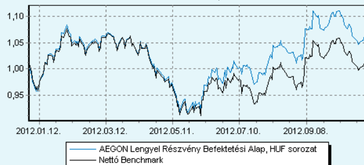
EGY JEGYRE JUTÓ NETTÓ ESZKÖZÉRTÉK, 2012.01.03 - 2012.10.31

Az alapok múltbeli teljesítménye nem nyújt garanciát a jövőbeli hozamok nagyságára. Jelen hirdetés nem minősül ajánlattételnek vagy befektetési tanácsadásnak. A befektetés részletes feltételeit az Alap Tájékoztatója tartalmazza, mely a mindenkor érvényes kondíciós listákkal együtt megtalálható a forgalmazási helyeken. A befektetési alap forgalmazásával (vétel, tartás, eladás) kapcsolatos költségek az alap kezelési szabályzatában és a forgalmazási helyeken megismerhetők.