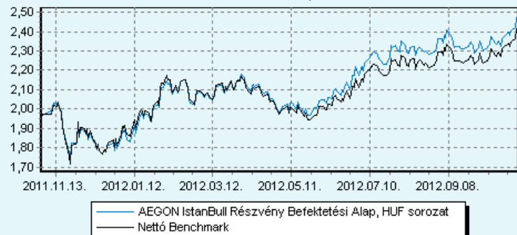
EGY JEGYRE JUTÓ NETTÓ ESZKÖZÉRTÉK, 2011.11.01 - 2012.10.31

Az alapok múltbeli teljesítménye nem nyújt garanciát a jövőbeli hozamok nagyságára. Jelen hirdetés nem minősül ajánlattételnek vagy befektetési tanácsadásnak. A befektetés részletes feltételeit az Alap Tájékoztatója tartalmazza, mely a mindenkor érvényes kondíciós listákkal együtt megtalálható a forgalmazási helyeken. A befektetési alap forgalmazásával (vétel, tartás, eladás) kapcsolatos költségek az alap kezelési szabályzatában és a forgalmazási helyeken megismerhetők.