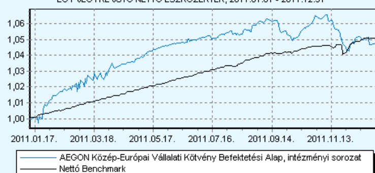
EGY JEGYRE JUTÓ NETTÓ ESZKÖZÉRTÉK, 2011.01.01 - 2011.12.31

Az alapok múltbeli teljesítménye nem nyújt garanciát a jövőbeli hozamok nagyságára. Jelen hirdetés nem minősül ajánlattételnek vagy befektetési tanácsadásnak. A befektetés részletes feltételeit az Alap Tájékoztatója tartalmazza, mely a mindenkor érvényes kondíciós listákkal együtt megtalálható a forgalmazási helyeken. A befektetési alap forgalmazásával (vétel, tartás, eladás) kapcsolatos költségek az alap kezelési szabályzatában és a forgalmazási helyeken megismerhetők.