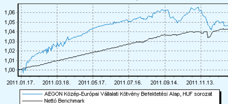
EGY JEGYRE JUTÓ NETTÓ ESZKÖZÉRTÉK, 2011.01.01 - 2011.12.31

Az alapok múltbeli teljesítménye nem nyújt garanciát a jövőbeli hozamok nagyságára. Jelen hirdetés nem minősül ajánlattételnek vagy befektetési tanácsadásnak. A befektetés részletes feltételeit az Alap Tájékoztatója tartalmazza, mely a mindenkor érvényes kondíciós listákkal együtt megtalálható a forgalmazási helyeken. A befektetési alap forgalmazásával (vétel, tartás, eladás) kapcsolatos költségek az alap kezelési szabályzatában és a forgalmazási helyeken megismerhetők.