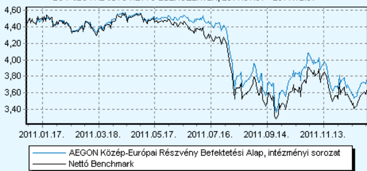
EGY JEGYRE JUTÓ NETTÓ ESZKÖZÉRTÉK, 2011.01.01 - 2011.12.31

Az alapok múltbeli teljesítménye nem nyújt garanciát a jövőbeli hozamok nagyságára. Jelen hirdetés nem minősül ajánlattételnek vagy befektetési tanácsadásnak. A befektetés részletes feltételeit az Alap Tájékoztatója tartalmazza, mely a mindenkor érvényes kondíciós listákkal együtt megtalálható a forgalmazási helyeken. A befektetési alap forgalmazásával (vétel, tartás, eladás) kapcsolatos költségek az alap kezelési szabályzatában és a forgalmazási helyeken megismerhetők.