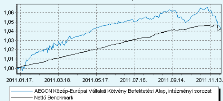
EGY JEGYRE JUTÓ NETTÓ ESZKÖZÉRTÉK, 2010.12.01 - 2011.11.30

Az alapok múltbéli teljesítménye nem nyújt garanciát a jövőbeli hozamok nagyságára. Jelen hirdetés nem minősül ajánlattételnek vagy befektetési tanácsadásnak. A befektetés részletes feltételeit az Alap Tájékoztatója tartalmazza, mely a mindenkor érvényes kondíciós listákkal együtt megtalálható a forgalmazási helyeken. A befektetési alap forgalmazásával (vétel, tartás, eladás) kapcsolatos költségek az alap kezelési szabályzatában és a forgalmazási helyeken megismerhetők.