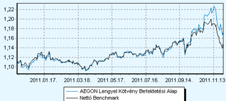
EGY JEGYRE JUTÓ NETTÓ ESZKÖZÉRTÉK, 2010.12.01 - 2011.11.30

Az alapok múltbeli teljesítménye nem nyújt garanciát a jövőbeli hozamok nagyságára. Jelen hirdetés nem minősül ajánlattételnek vagy befektetési tanácsadásnak. A befektetés részletes feltételeit az Alap Tájékoztatója tartalmazza, mely a mindenkor érvényes kondíciós listákkal együtt megtalálható a forgalmazási helyeken. A befektetési alap forgalmazásával (vétel, tartás, eladás) kapcsolatos költségek az alap kezelési szabályzatában és a forgalmazási helyeken megismerhetők.